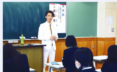
出前授業 (県立尾上総合高等学校)

講師の方から、人生の半分の17年間、常に目標を持ちながら美容師を続けているという話を伺い、私も長期間にわたって続けられることを見つけて、仕事にしたいと思いました。