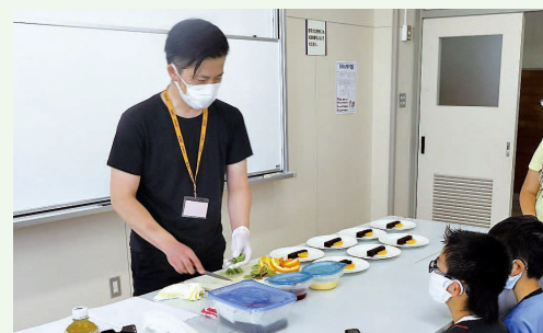
出前授業 (むつ市立奥内小学校)

調理の様子を見ていて、自分だけのケーキのトッピングが自然と浮かんできて、すごく楽しかったです。家に帰ってから、もう1回やってみようと思いました。