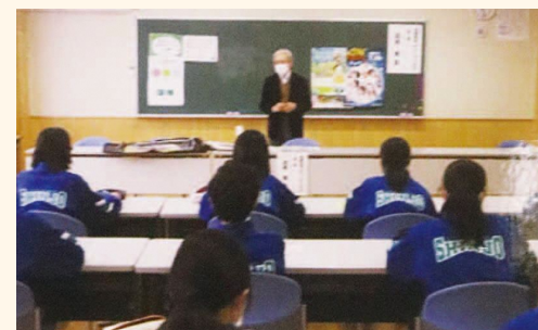
職業講話 (青森市立新城中学校)

少し絵が下手な人でも、絵を描くことが好きならグラフィックデザイナーに向いているという話が特に印象に残っていて、これからは模写でもいいからたくさん絵を描きたいと思いました。