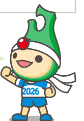
大会マスコット「アップリート君」