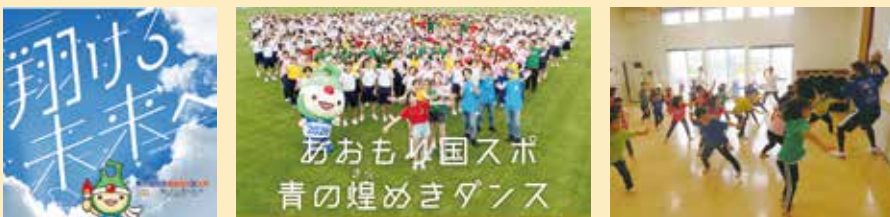
小学校や幼稚園等での「青の煌めきダンス出前教室」▲

RINGOMUSUME(りんご娘)が歌う大会イメージソング「翔ける未来へ」にのせ、振付けに青森県を表現するポーズやねぶたの跳人の動き、手話による表現などを盛り込んだ、青森らしいユニバーサルデザインダンスです。