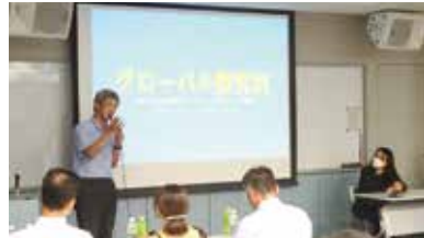
グローバル探究科を紹介する青森南高校の先生

A グローバル化が進む社会に対応するため、語学力だけではなく、多様性を尊重する心や幅広い教養、問題発見・解決能力などの国際的素養を身につけたグローバル人材を育成する学科です。