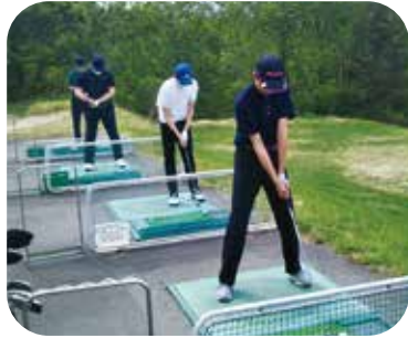
鱒ヶ沢高校 新設されたゴルフ部の活動風景

(一財)地域・教育魅力化プラットフォームが都道府県の枠を越えた高校留学を推進するため、事業参画校による合同学校説明会(オンライン方式、対面方式)等を実施しています。