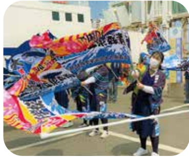
大間高校 めんちょこ活動部による旗振り