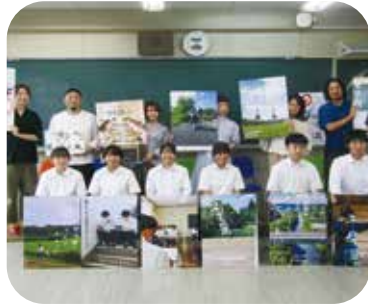
三戸高校 クリエイティブ部で魅力再発見