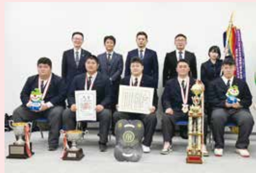
【令和4年度全国高等学校相撲選抜大会団体優勝】 青森県立五所川原農林高等学校 相撲部