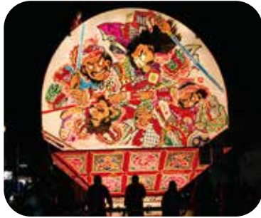
柏木農業高校 ねぶた運行の様子