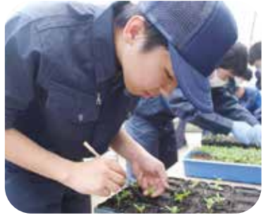
名久井農業高校 農業実習の様子