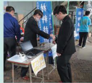
(材料技術科の学びを紹介する様子)

拠点校である八戸工業高校の材料技術科の学びを、十和田工業高校の文化祭において紹介することにより、十和田工業高校の生徒は、自校にはない学習内容について知る機会が得られ、八戸工業高校の生徒は、学習内容を相手に伝えることでこれまでの学びについて理解を更に深め、コミュニケーション能力を養う機会となりました。