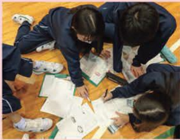
(仮説のコストを協力しながら計算する様子)

この取組を通して、課題設定・仮説立案・考察・まとめ・発表という探究の流れを体験し、探究活動の理解を深めました。