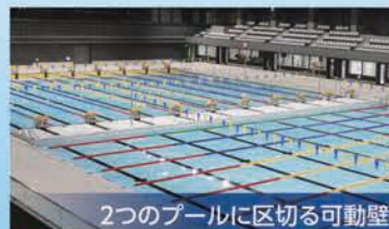
2つのプールに区切る可動壁

そのほか大会記録などを映す大型映像装置や約1,000人収容の観客席のほか、隣接する25mプールとの間を水着のまま自由に行き来できる廊下(ウェットコリドー)などがあります。