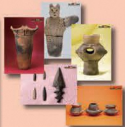
これらのカードは令和4~5年に制作したものです。