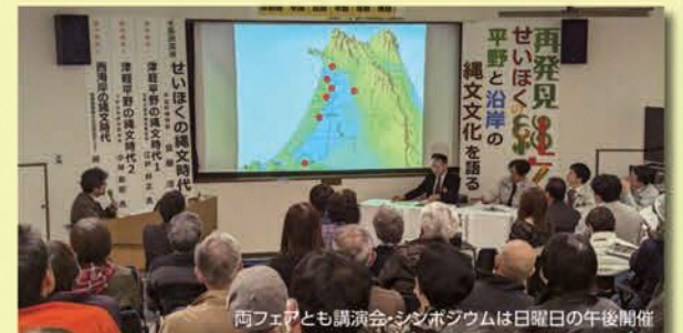
両フェアとも講演会・シンポジウムは日曜日の午後開催

ベテランの研究者による講演と地元研究者による地元の縄文遺跡の解説後、「地元の縄文」について楽しく議論し、「地元の縄文」グッズ等を考えます。