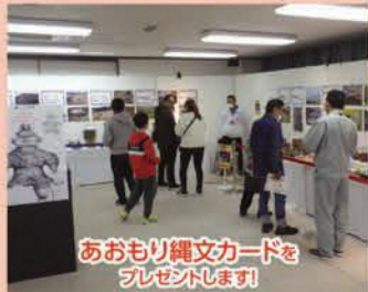
あおもり縄文カードをプレゼントします!

地元の縄文土器や土偶等の「実物」を写真パネル等とともにわかりやすく展示・解説します。露出展示を基本としますので、縄文遺物を「直に」、「間近に」見ることができます。