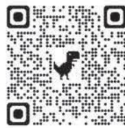
「地元の縄文」再発見フェアのページ

今年度も「地元の縄文」を再発見するフェアを県内2カ所(三沢市・青森市)で開催します。令和4年から実施してきたこのフェアも 今年で最後 です。ぜひお越しください!