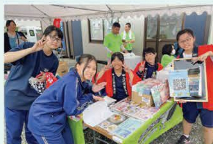
「みさわ七夕まつり」で三沢商業高校と青森商業高校の生徒と一緒に販売実習を実施