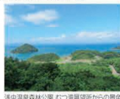
浅虫温泉森林公園 むつ湾展望所からの景色

問 青森県立郷土館 TEL.017-777-1585 https://www.kyodokan.com