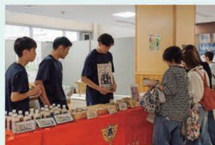
「青商祭」で青森商業高校、三沢商業高校、八戸商業高校の開発商品を販売

内容 課題研究の学習において、各校の生徒間の連携・協働による問題解決能力の育成を目的として、各校で開発している商品の販売実習を文化祭や地域イベントで実践します。