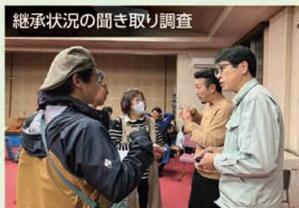
継承状況の聞き取り調査