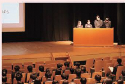
各校が日々の探究学習の成果を発表