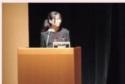
五所川原高校の生徒が進行を担当

内容 西北地区の県立高校5校、私立高校2校の全7校が集まり、各校の特色を生かした探究学習の成果について、学校や学科の枠を超えて発表や質疑応答を行います。この取組を通して、新たな視点を生むなど、生徒一人一人の学びを深め、西北地区全体の教育活動の質の向上を図ります。