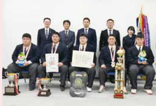
【令和4年度全国高等学校相撲選抜大会団体優勝】 青森県立五所川原農林高等学校 相撲部