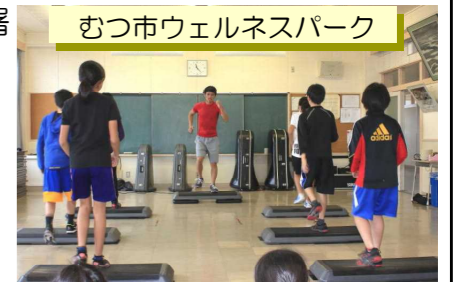
むつ市ウェルネスパーク