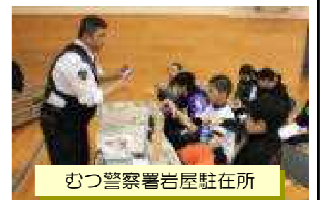
むつ警察署岩屋駐在所