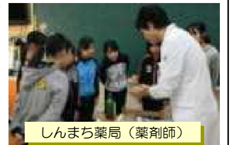
しんまち薬局（薬剤師）