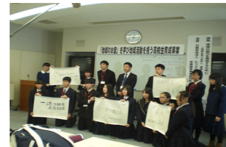
東青地区高校生との交流会