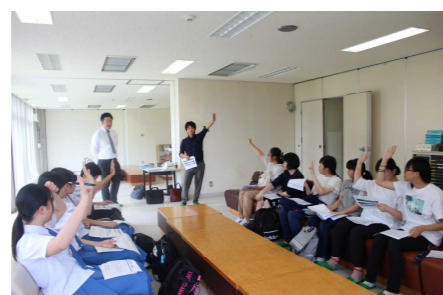
東通村：ワークショップ