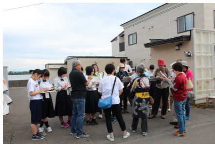
むつ市：フィールドワーク