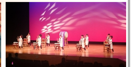
柳町ひまわり保育園