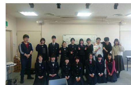
むつ市・東通村の交流会

県教育委員会は、この事業を通して高校生が自分たちの地域の魅力に気付き、それを「物語」として内外に発信することにより、地域への愛着と誇りが生まれ、次代の地域を担う人財(※)として成長することを期待しています。