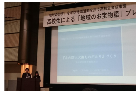
むつ市：プレ発表会(青森市)