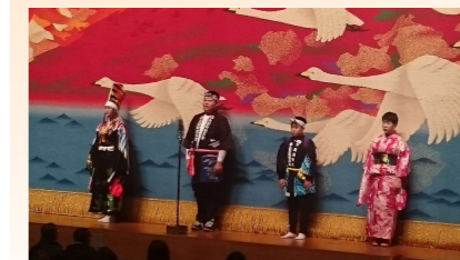
子ども会4団体の代表