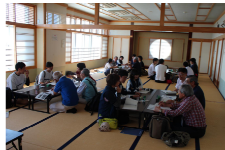
むつ市：ワークショップ