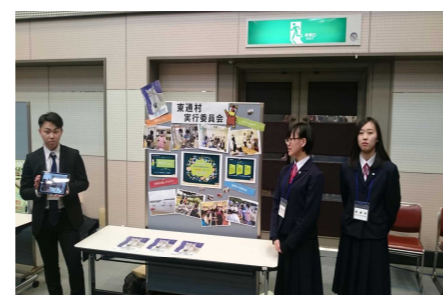
東通村：プレ発表会(青森市)