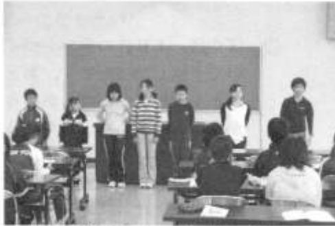
であいの集い・自己紹介 6班