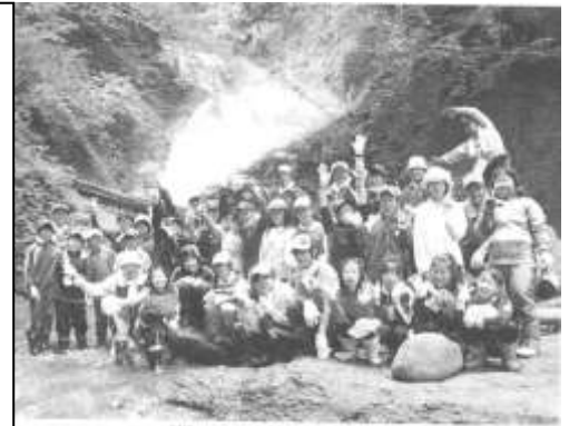
夏休みのキャンプ・活動の場を背景に

40年以上前から、地域リーダーを育成するための子ども会行事として続いています。全体的に言えることですが、少子化と学校外活動の多様化等により、子ども会のリーダー研修会は衰退の傾向にあります。むつ市も例外ではなく、昔は100名を超える参加者がいて、小学生を対象とした初級から、中学生や高校生を対象とした中級・上級まで研修会があったそうですが、最近は初級のみ、約30名ほどの参加者で続いています。