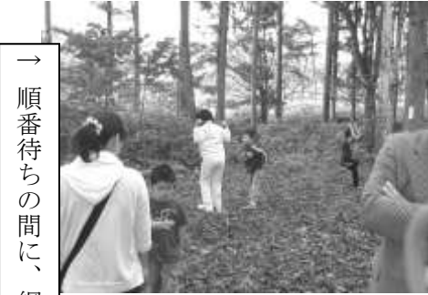
→ 順番待ちの間に、綱渡りやそば打ち台作り