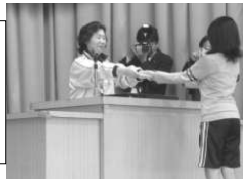
閉校式 修了証授与