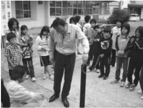
国土交通省職員による環境教育