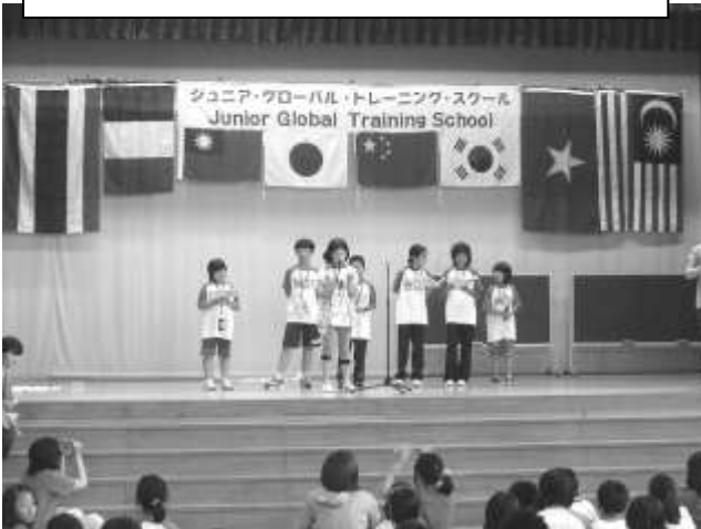
閉校式で、グループごとに感想を発表