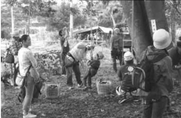
ツリーイングとは、ロープを使った木登りです