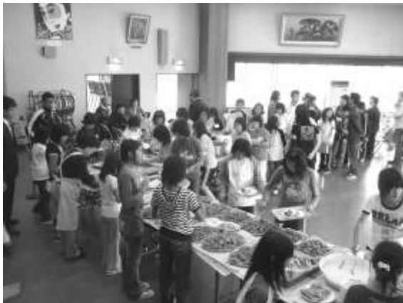
さよならパーティ