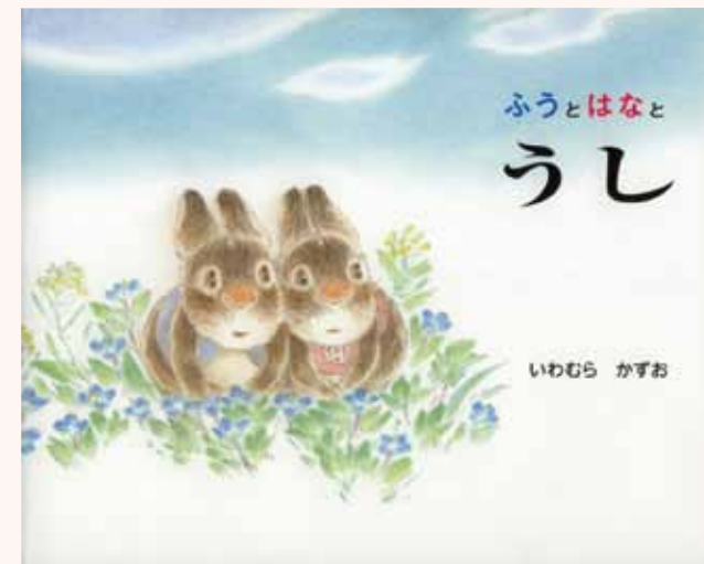
「ふうとはなとうし」 (童心社)

1998年「いわむらかずお絵本の丘美術館」（那珂川町）を開館、絵本・自然・子どもをテーマに活動を続けている。