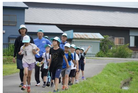
じょっぱりロード 2022 の様子