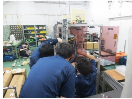
インターンシップの様子