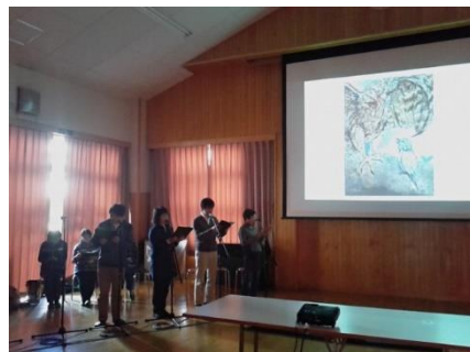
体験型出前授業の様子