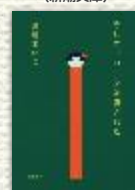
『そして、バトンは渡された』 (文藝春秋)