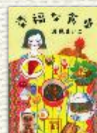
『幸福な食卓』 (講談社文庫)