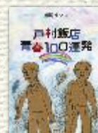
『戸村飯店 青春100連発』 (理論社)