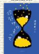
『夜明けのすべて』 (水鈴社)