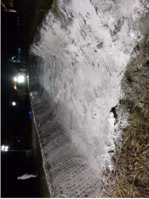
R03. 12. 12 消石灰散布完了