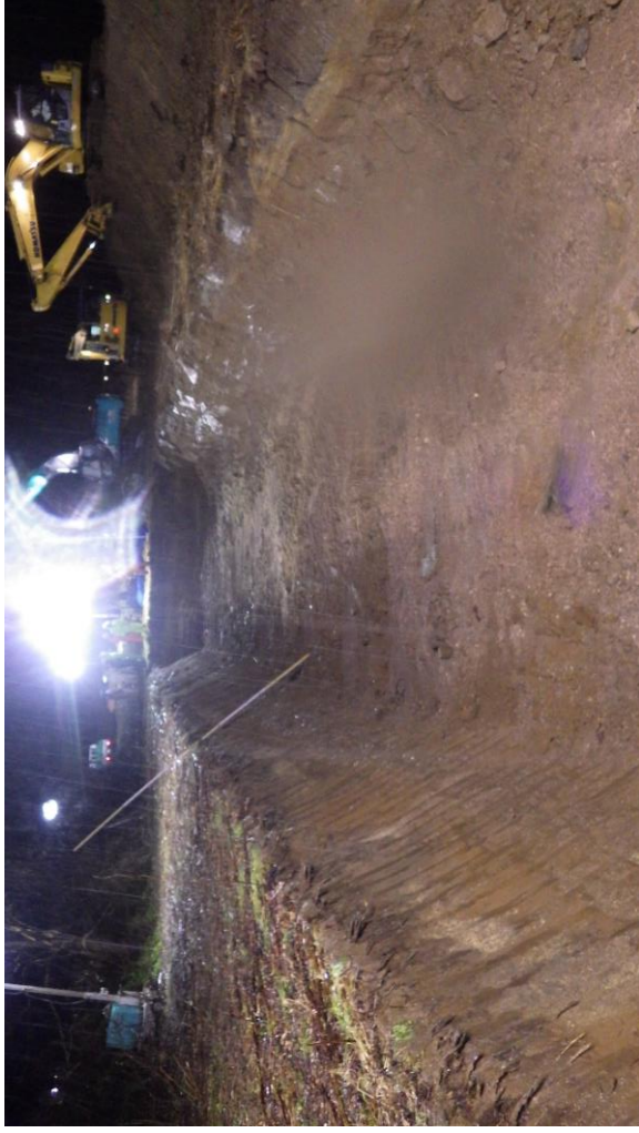
R03. 12. 12 掘削完了