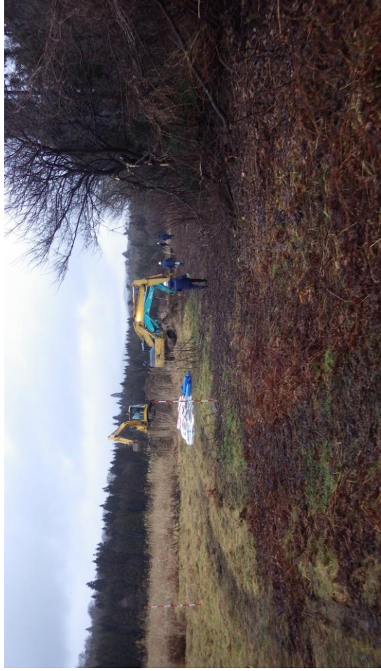
R03. 12. 12 掘削着工前