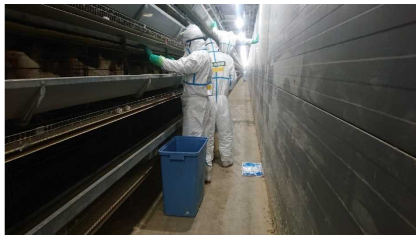
③2022. 12. 19 (5 時頃) 自衛隊による防疫作業 1