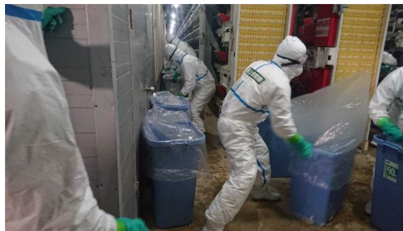
③2022. 12. 19 (5 時頃) 自衛隊による防疫作業 2