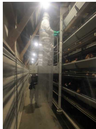
②2022. 12. 18 (21 時頃) 県職員による防疫作業 (5 段ケージ)