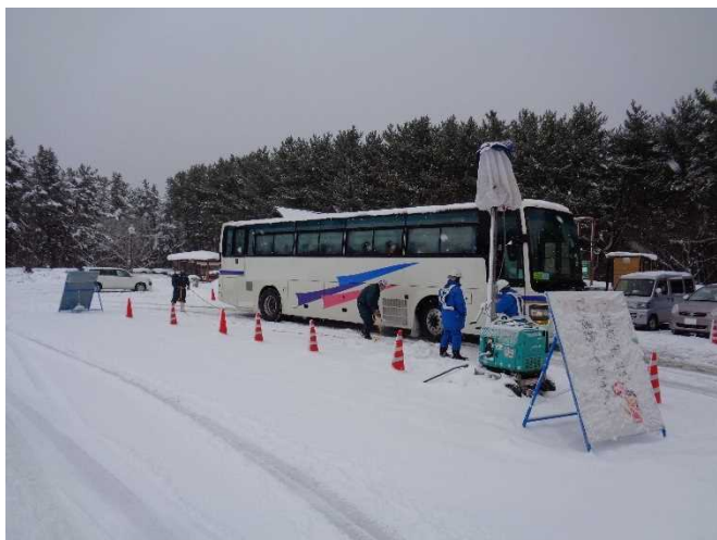
①2022. 12. 18 (14 時頃) 消毒ポイントでの防疫作業