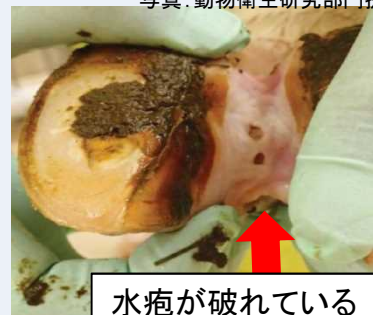
水疱が破れている