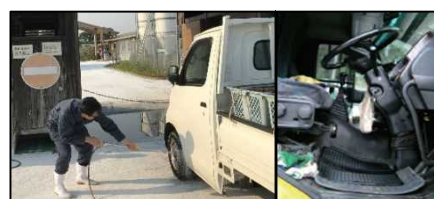
タイヤだけでなく、 泥よけの内側まで消毒 。 フロアマットの交換やペダル等、 車内も消毒 。