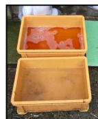
！推奨される踏込消毒槽の設置方法！