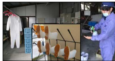
専用の服や靴の使用、手指消毒