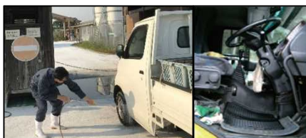
タイヤだけでなく、 泥よけの内側まで消毒 。 フロアマットの交換やペダル等、車内も消毒 。