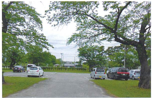
近隣の学生は通学も可能