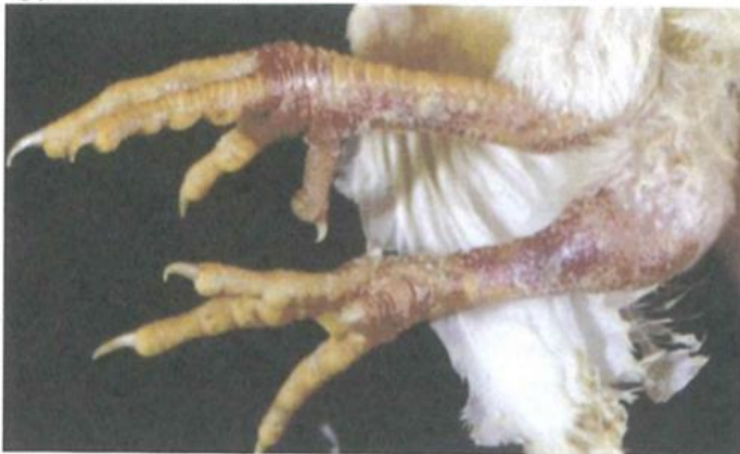
写真3. 脚部の皮下出血（真瀬昌司・谷村信彦原図）