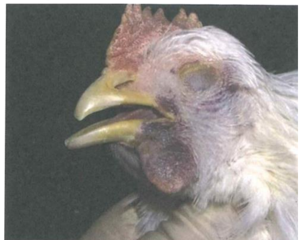
写真4. 宮崎株実験染鳥 肉垂のチアノーゼが見られる