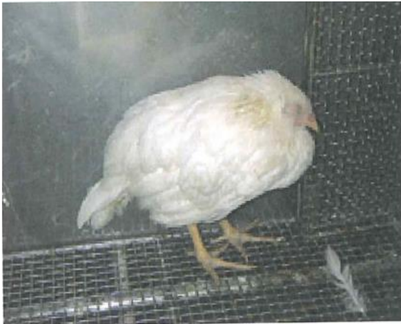
写真1. 感染し、元気をなくした鶏（真瀬昌司原図）