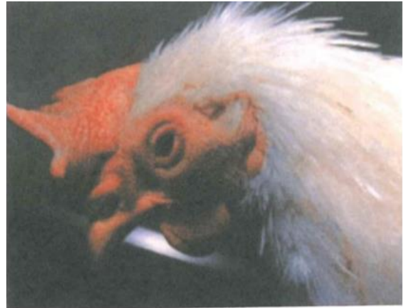
写真2. 突然の沈うつ、すぐ死亡