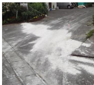
(農場出入口の消石灰帯)