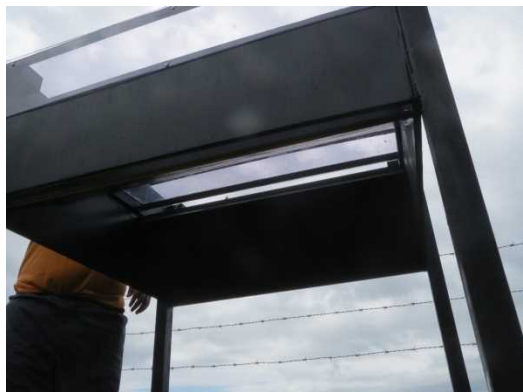
↑ アブトラップを下から見た図