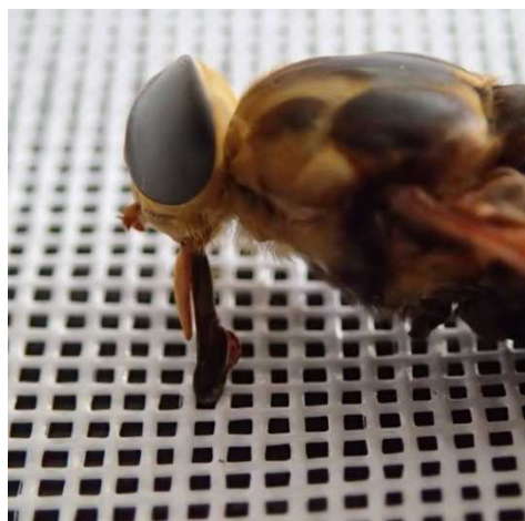
←口器を通過させない