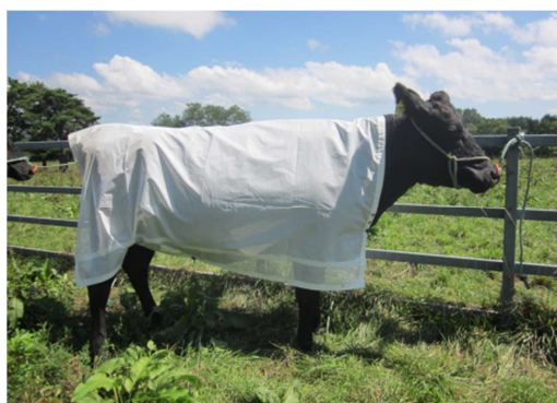
↑ アブジャケットを着用した牛