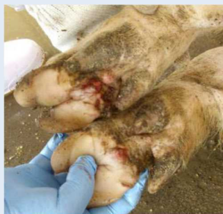
蹄球部皮膚のびらん、潰瘍