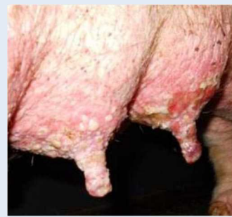
乳房、乳頭の水疱、びらん、痂皮