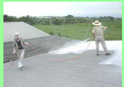
屋根への石灰塗布