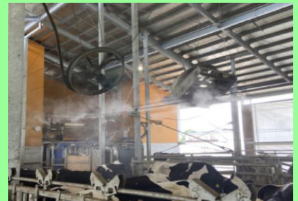
牛舎細霧

飼養している家畜に異状が見られた場合には、直ちに獣医師、または 家畜保健衛生所 にご連絡ください。