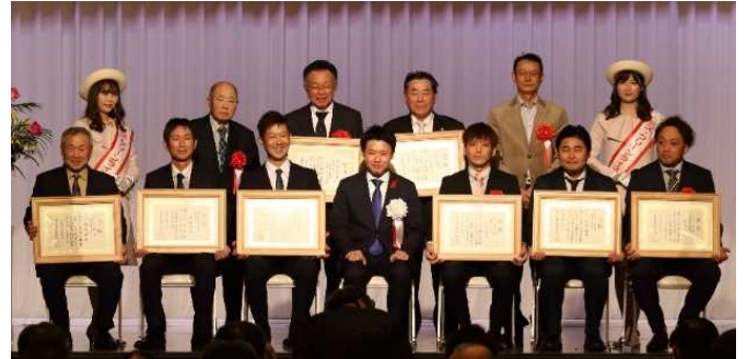
昨年の受賞者の皆様

表彰式は、令和6年12月に開催予定の「青森の「米づくり新時代」推進大会」（仮題）において表彰する。