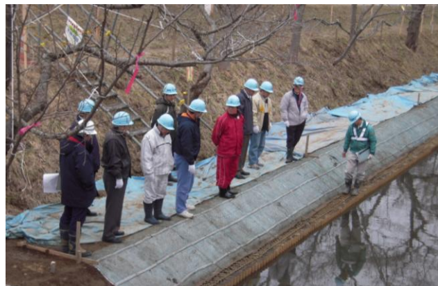
協議会による現地検討会の様子

また、水路沿いには「湖畔千本桜」と呼ばれる桜並木や散策道があり、地域住民が景観を楽しむコースとなっていることから、転落防止柵には地域資源である間伐材を利用しました。