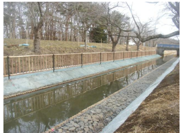
生態系に優しいカゴマット工法

そこで、魚類の隠れ家となる隙間を確保し、生態系を守る水路の工法として、金網のカゴに石を詰めた「カゴマット」が使われました。