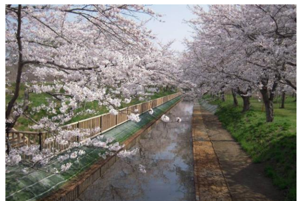
整備後の南谷地幹線排水路と湖畔千本桜

水路整備は平成24年度に完了する予定ですが、協議会では、それ以降も生き物調査や草刈りなどを継続し、施設の維持管理を地域自らが行っていくこととしています。