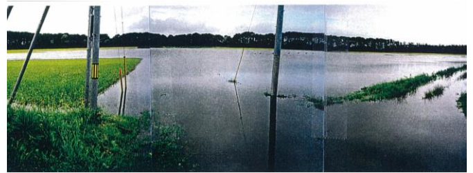
水田等の湛水状況

本地区は、東北町の小川原湖沿いの低平地に位置していることから、降雨のたびに水田や周辺の住宅地が浸水に悩まされてきました。このため、排水機場の改修（県営花切地区湛水防除事業：H9～13）を実施し、現在は幹線排水路の整備（県営上北地区農村振興総合整備事業：H19～24）に取り組んでいます。