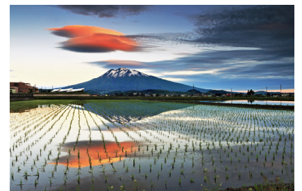
「金魚が泳いだ五月の朝」

（環境公共学会HP： http://www.aodoren.or.jp/kankyokoukyo-gakkai/photocontest.html ）