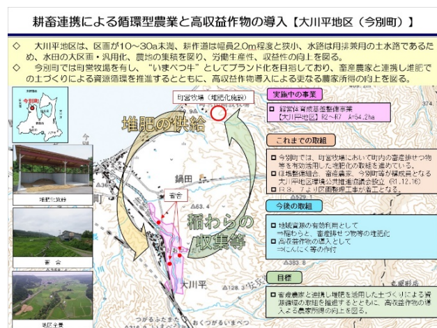
環境公共モデル地区PR資料

また、本地区は東青管内の環境公共モデル地区として位置づけられており、「耕畜連携による循環型農業と高収益作物の導入」と称し、地区内で発生した稲わらと家畜排せつ物等の堆肥を活用した土づくりによる資源循環の取組を推進するとともに、高収益作物の導入による地域の所得向上を図ることを目標としています。