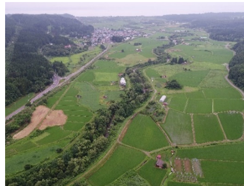
地区全景(ドローン撮影)

こうした課題を解決するべく、令和2年度から経営体育成基盤整備事業(ほ場整備事業)に取り組んでいます。