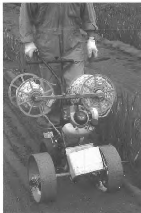
写真2 動力式シーダー (TEM-2612-L)

価格：日本プラントシーダー・TSA-L (人力式) 39,900円 日本プラントシーダー・TEM-2612-L(動力式) 141,750円 テープ加工料金 (1m当たり) 10円 (10a当たり833m) 8,750円