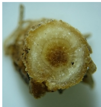
写真4 ナス根腐疫病罹病株 の症状 (根の中心柱の褐変) (平成30年8月9日撮影) (平成30年 青森野菜研)