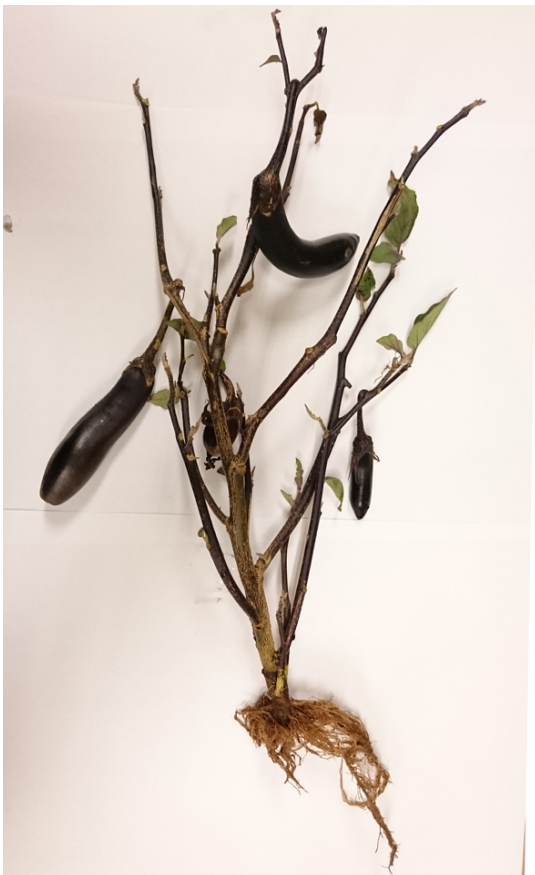
写真3 ナス根腐疫病罹病株の症状 (落葉 および根の褐変) (平成30年8月9日撮 影) (平成30年 青森野菜研)