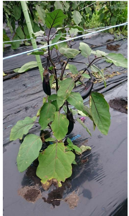
写真2 ナス根腐疫病罹病株の症状 (萎凋 および生育抑制) (平成30年8月9日撮影)