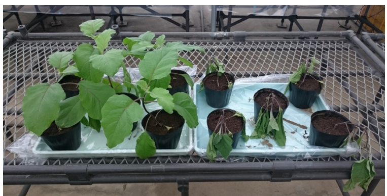
写真6 健全株 罹病株 接種によるナス根腐疫病的発病 (平成30年12月10日撮影) (平成30年 青森野菜研)