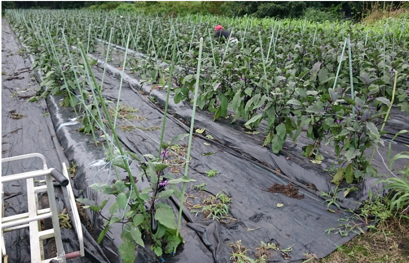
写真1 ナス根腐疫病発生圃場 (平成30年8月9日撮影) (平成30年 青森野菜研)