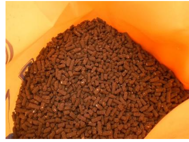
写真2 豚糞堆肥の形状（ペレット状）