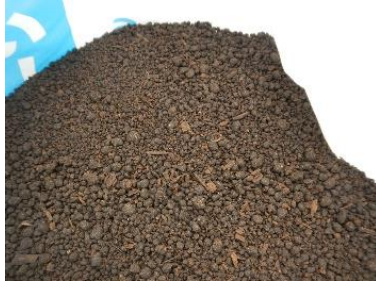
写真1 鶏糞堆肥の形状（粒状）