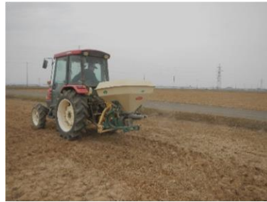
写真3 ブロードキャスターによる資材散布状況