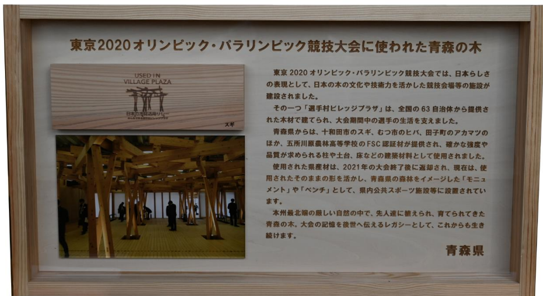
PR パネル（縦 41.4cm×横 73.8cm）