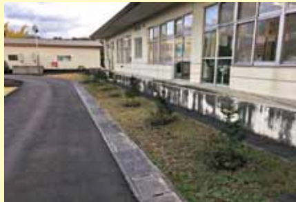
公共施設等の緑化の推進