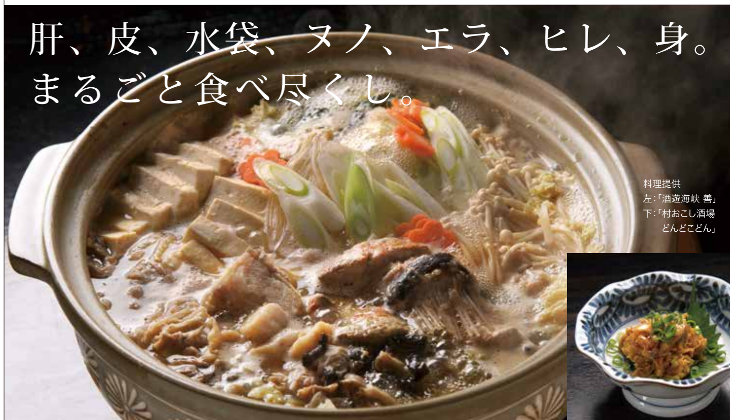
料理提供 左:「酒遊海峽 善」 下:「村おこし酒場 どんどこん」