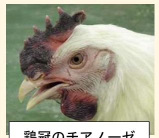
鶏冠のチアノーゼ

家畜伝染病を疑う異状が見られたら、直ちに つがる広域家畜保健衛生所 にご連絡ください 電話：0173-42-2276 夜間・休日：090-8788-7459