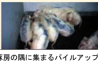
豚房の隅に集まるパイルアップ