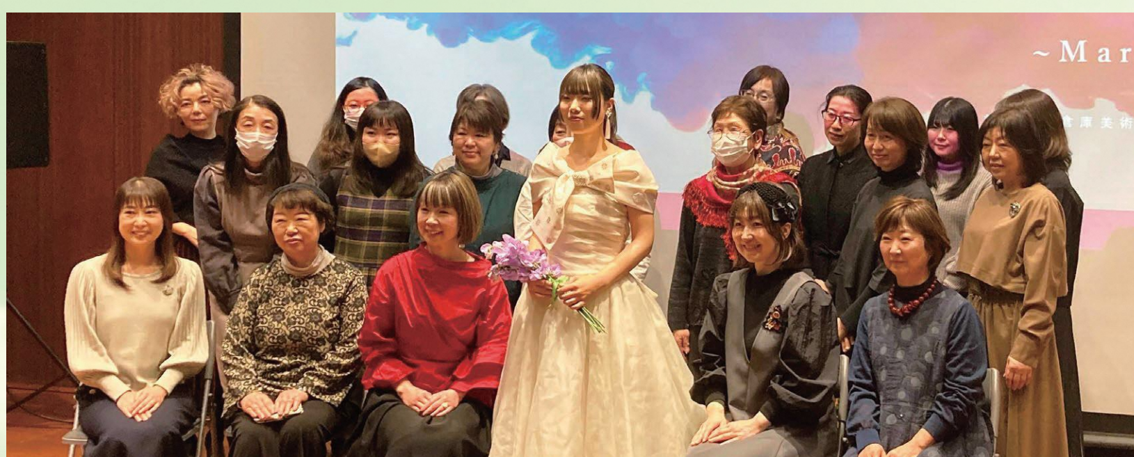
伝統工芸「こぎん刺し」を施したウェディングドレスの共同制作