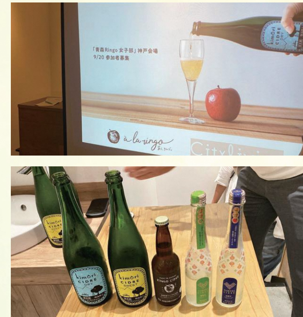
リンゴのお酒「シードル」とスイーツのペアリングイベント