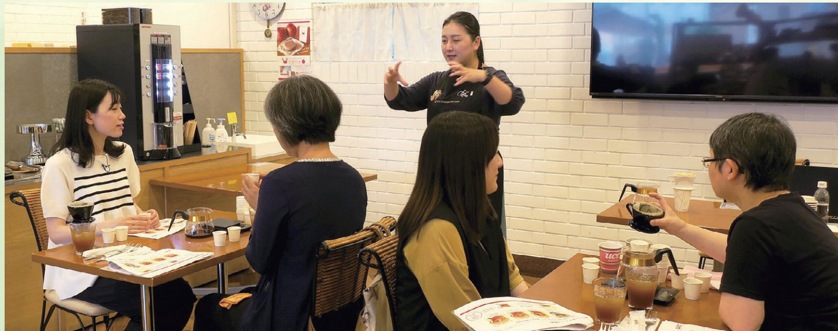
コーヒー原料を使用したお菓子の共同開発・販売とプロモーション

神戸市等の企業を本県に招へいし、県内の幅広い業種の企業との間で、連携した取組の可能性を探るワークショップを開催したほか、モデルとなる連携ビジネスプランを選定して情報発信を支援するなど、ビジネス連携に向けた気運醸成に取り組んでいます。