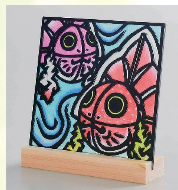
青森県の伝統工芸・技法・文化を活用した手作り体験キットの商品化