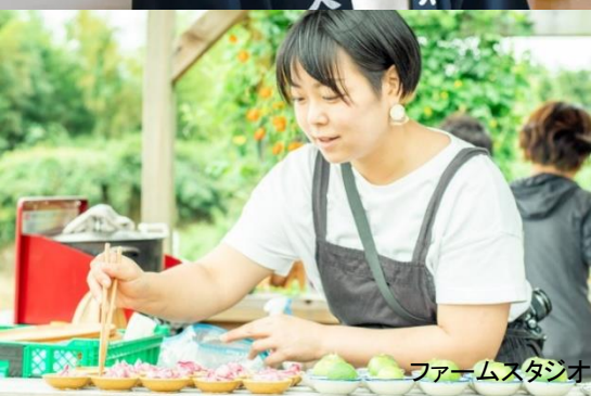
ファームスタジオ