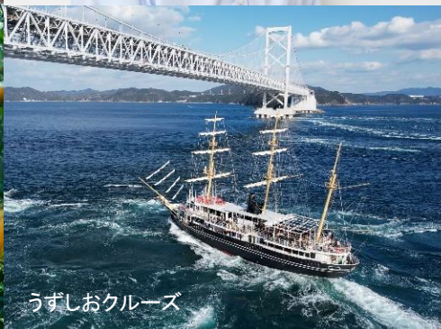
うずしおクルーズ