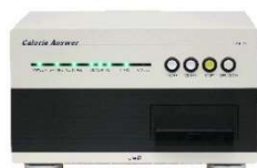
(令和5年度認定商品) カロリーアンサーCA-Hi

※平成17年度制度創設、令和6年4月1日現在12者16件を認定中 (累計認定数75者121件)