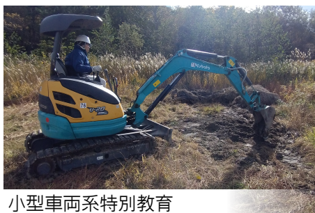
小型車両系特別教育