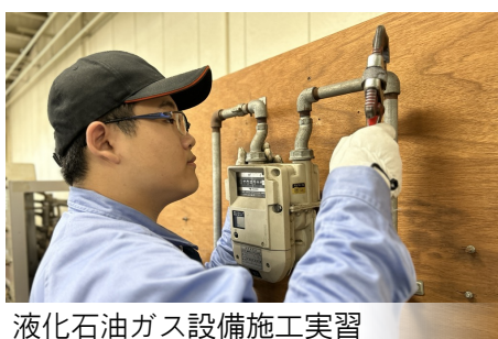
液化石油ガス設備施工実習