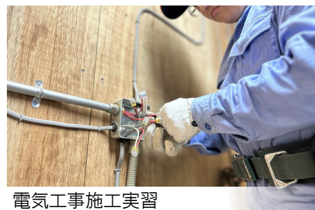
電気工事施工実習