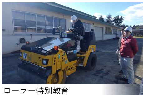
ローラー特別教育