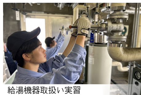
給湯機器取扱い実習