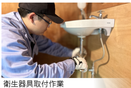
衛生器具取付作業