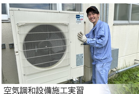
空調設備施工実習