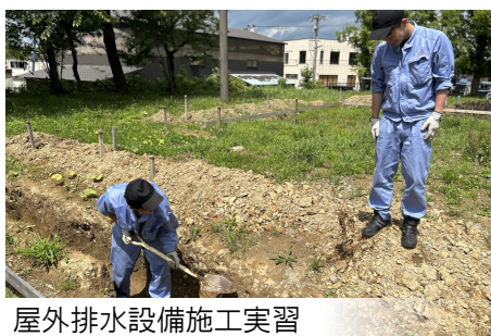
屋外排水設備施工実習