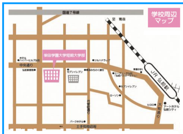
JR弘前駅中央口から徒歩約10分 最寄りバス停：中土手町、上代官町、中央通り1丁目各バス停より徒歩3分