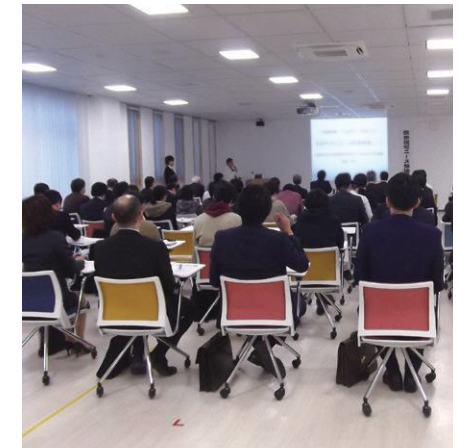
医療従事者が企業に直接、現場の困りごとやニーズを説明する勉強会を毎年開催