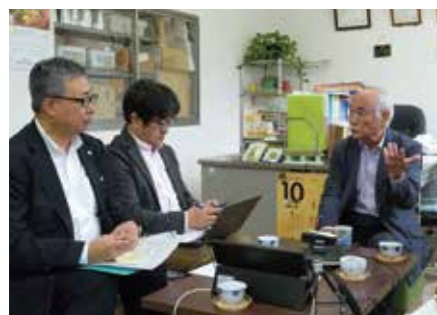
機能性表示食品の開発に向けアドバイス

着目したのは、桑葉に含まれる「GABA」。GABAには、血圧が高めの方の血圧を低下させる機能があることが報告されています。GABAの濃度を1日摂取量の目安である12.3mgまで補強し、特に血圧が高めの方に