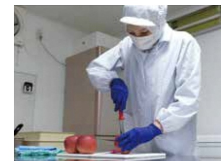
すべて手作業で丁寧に作り上げる「りんご玄米茶」

りました。ノンカフェインなので時間を気にしなくてもいいのが嬉しいところ。「お子様にも安心して飲んでもらえる」としています。