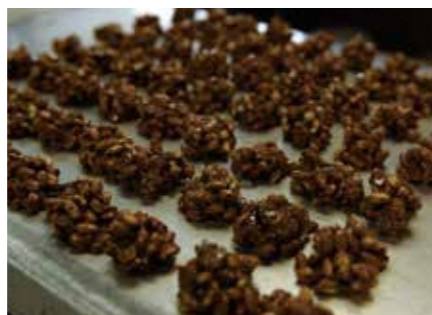
何度も試作を重ねた「あおもりロシエ」

という目標もクリアしました。素材本来の美味しさや、食感を存分に楽しめるように工夫され、カロリーや糖質にも配慮した商品でありながら、味・食べ応えともに満足させてくれる仕上がりとなった「あおもりロシエ」。健康志向の人にも自信を持ってオススメできる商品です。