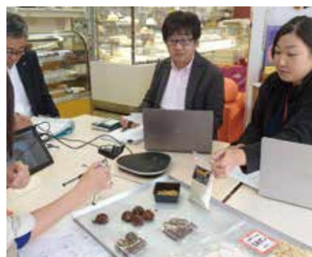
原材料と試作品を並べアドバイス

当初はスティック状にする予定でしたが、1袋100kcalに抑えることを目指し、ボール型に変更。試行錯誤を繰り返し、糖質10g以下