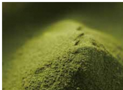
こだわりの桑を使用した「美味桑茶」