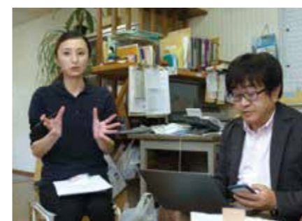
試飲しながら風味のアドバイス

このたび誕生した商品は、玄米の香ばしさと県産りんごのほのかな甘みと酸味が効いた「りんご玄米茶」。玄米は弱火でじっくり丁寧に炒り、二種類の焙煎度合いをブレンドしています。りんごは糖度の高いものを使用し、りんご本来の甘さを感じられる仕上がり。そこにビタミンCを配合し、お肌も喜ぶお茶にな