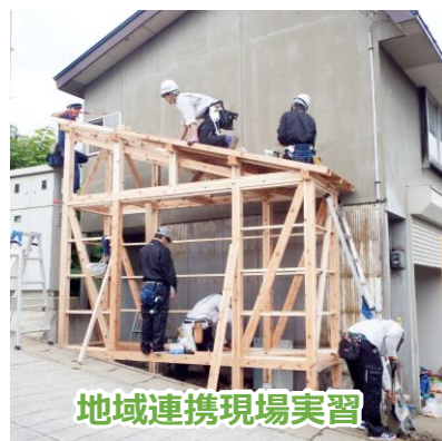
地域連携現場実習