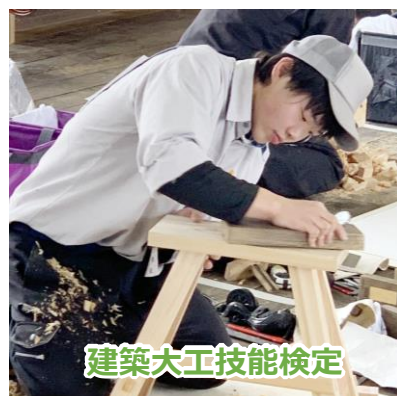
建築大工技能検定

職業能力開発促進法に基づく公共職業能力開発施設です。詳しくはWebで「むつ技専」を検索！ http://www.pref.aomori.lg.jp/soshiki/shoko/mu-gisen_top.html