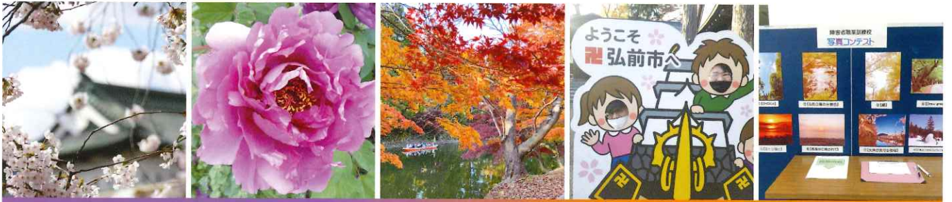
校外実習・校内フォトコンテスト