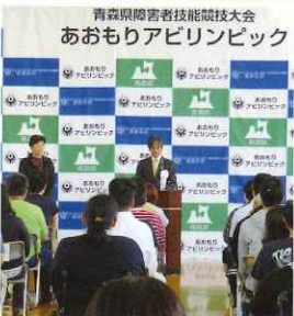
あomorアビリンピック参加 (任意参加)