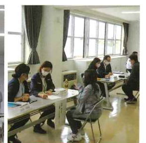
障害者就業・生活支援センター説明会