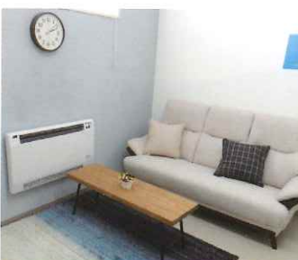
リフレッシュルーム