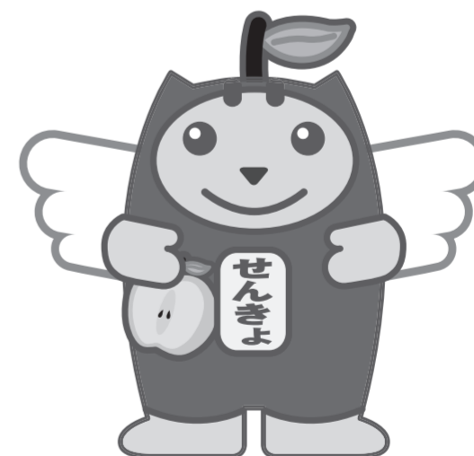
林檎っこめいすいくん

新型コロナウイルス感染症で自宅・宿泊療養などをされている有権者は特例郵便等投票が利用できます。