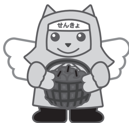
りんご農家めいすいくん

期日前投票所の一覧を県選挙管理委員会ホームページに掲載しています。一部の投票所では、投票時間を変更していますので、ご注意ください。