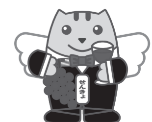
スチューベンめいすいくん

https://www.pref.aomori.lg.jp/soshiki/senkan/tokureiyuubin.html