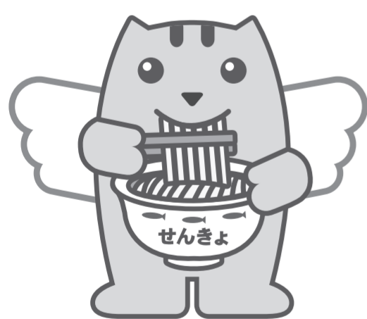
煮干しラーメンめいすいくん

期日前投票所の一覧を県選挙管理委員会ホームページに掲載しています。一部の投票所では、投票時間を変更していますので、ご注意ください。