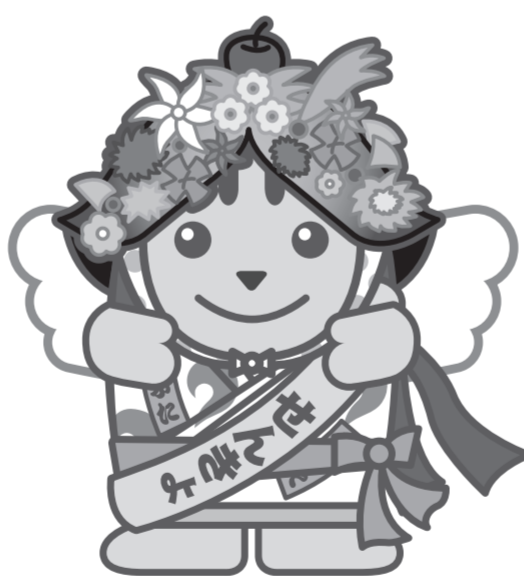
ねふたハネトめいすいくん