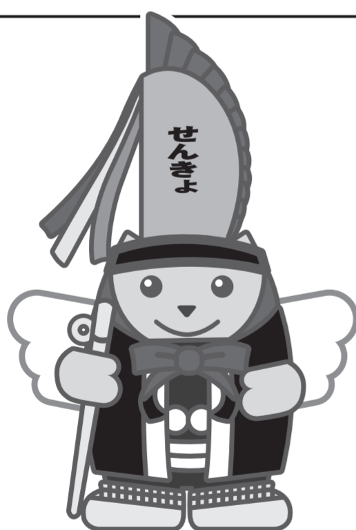
えんぶりめいすいくん

期日前投票所の一覧を県選挙管理委員会ホームページに掲載しています。一部の投票所では、投票時間を変更していますので、ご注意ください。