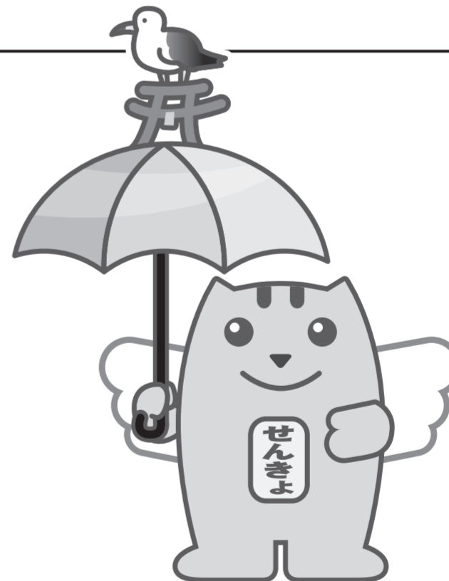
燕嶋ウミネコめいすいくん

新型コロナウイルス感染症で自宅・宿泊療養などをされている有権者は特例郵便等投票が利用できます。