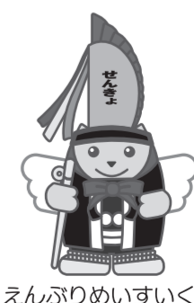
えんぶりめいすいくん

https://www.pref.aomori.lg.jp/soshiki/senkan/tokureiyuubin.html