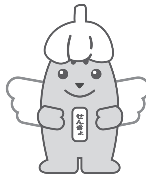
にんにくめいすいくん

新型コロナウイルス感染症で自宅・宿泊療養などをされている有権者は特例郵便等投票が利用できます。