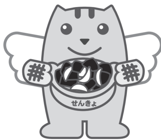
バラ焼きめいすいくん