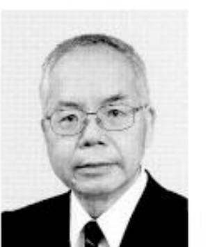
最高裁判所判事 横田尤孝 昭和一九年一〇月二日生

最高裁判所は憲法判断の最終審であるという重大な職責を負っています。その立場を深く自覚して見識ある判断を行うために全力を尽くして参ります。