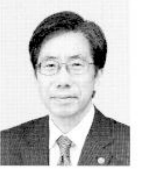
最高裁判所判事 ちば かつみ 千葉勝美 昭和二十二年八月二五日生

最高裁判所に就任して約一〇か月であり、関与した著名事件は僅かですが、様々な分野にわたる数多くの事件に触れ、社会の多様化と裁判の重要性を改めて感じています。 就任するまで約四〇年間、弁護士として様々な事件に関与してきました。弁護士の活動が、法的な枠組みの中で、特定の依頼者を前提に、その権利の実現を図ることにより正義の実現を目指すといったものであるのに対し、特定の依頼者を前提としない裁判官の職務には、最初は戸惑いもありました。現在では、独善に陥ることのないよう常に自戒をしながら、自らの良心に従って憲法及びその他の法令の解釈適用を行うことで正義の実現を図ることがその職務であると考え、実践しております。 具体的な事件の処理に当たっては、物事の多面性を踏まえ、開かれた態度で様々な意見に耳を傾け、最後までより正しい道を探り、勇気を持って決断する、こうした姿勢で一つ一つの事件を誠実に扱っていきたくと思っています。