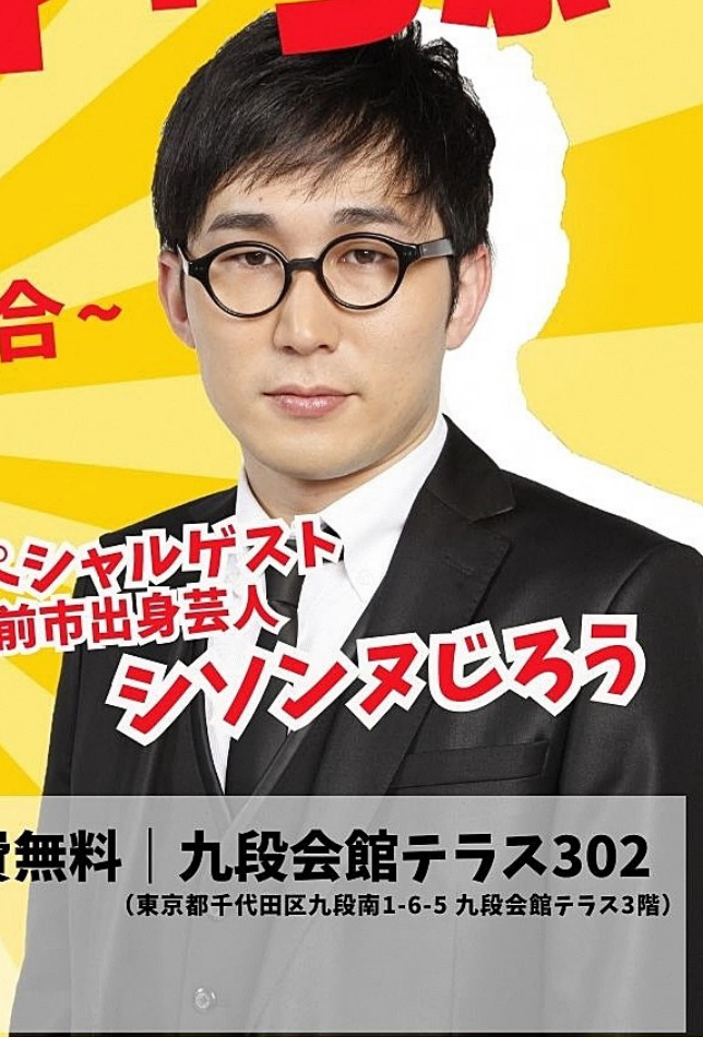
スペシャルゲスト 弘前市出身芸人