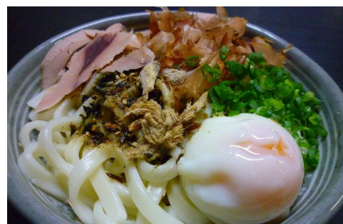
西伊豆しおかつうどん