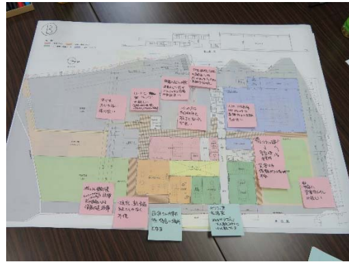
ワークショップ開催の様子 (全2回開催)