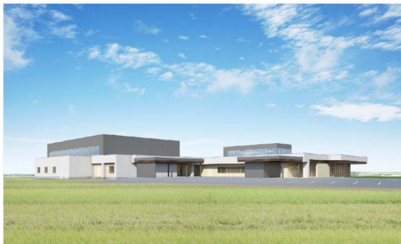
障害者交流センターねむのき会館(仮称)改築設計業務委託 外観イメージパース 1 (南西側) 株式会社八洲建築設計事務所